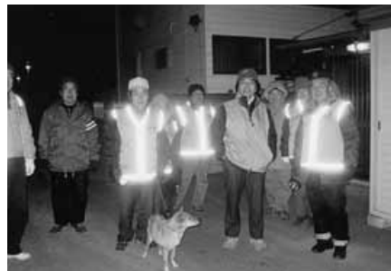
地域安全防犯パトロール

資源回収事業に取り組み、毎月一回全世帯を対象に呼びかけ、当番制を設け共同で回収作業を実施し、「敬老の集い」や「ボウリング大会」、六月に行われる地区体育祭など多彩な行事に貴重な収益金を充て、一度も絶やすこともなく今後ともよき後継者により引き継がれていくものと思います。また、昨年十一月に高齢者部会による防犯活動を主とした「新川島安全クラブ」が結成され、通学路の安全確保と見守り活動を実施に移し、街頭犯罪防止の抑止力に少しでも貢献できればと願いながら努力しております。そのほか、定例班長会を毎月招集し、必要により役員会・幹事会の開催を要請、年間を通しても行事の遂行と新しい入居者の方々が積極的に地域活動に参