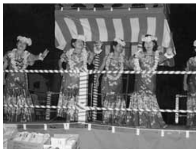
納涼祭フラダンス「マハロフラ」

勝でした。十二月になりますと、ロケット公園で町内最高のイベント「餅つき大会」が行われます。もちろん、全世帯を基本としています。無料でお菓子、飲み物が出ます。餅つき初体験コーナーもあります。この他、毎月第二火曜日にはふれあいいきいきサロンを上谷原区画整理記念館で開催し、充実感を感じながら