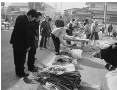
いい仲ふれあい広場