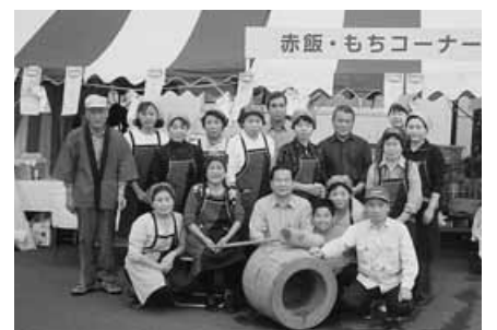
婦人部と役員さん

私たちの住む大場新田自治会を紹介させていただきます。平成十五年四月、大場自治会より独立して、八町会二七班四三二世帯で構成されており、武里西小学校と旧沼端小学校の周辺で、当自治会の中央に県道野田岩槻線が通っています。主に調整区域で環境も良く、近年住宅地として発展しております。当自治会