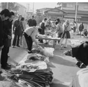
いい仲ふれあい広場

気強く指導にあたる町会関係者、三者が一体となってこそのお囃子会です。先人が生み出した地域の宝として、これからも大切に維持保存していかなければと心しています。次に、「新仲ふれあい広場」は、災害時にお互いをいたわり、助け合つ心情を醸成するには、普段の「親睦・ふれあい」が大切との思いから開催したもので、バザーや手作り料理を囲みながら談笑の一時を過ごす中での新しい仲間との出会い等、お子さんも含めて活気あふれる、喜ばれる場にするため努力しており、バザーの収益金については、市に寄付させていただいております。