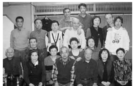
正善第一自治会の年間のイベントを支える人たち

自治会の年間イベントから紹介しますと、五月中旬に自治会主催のバーベキュー大会とビンゴゲーム大会、七月中旬に備後下地区五自治会主催のカラオケ大会・子ども会を主にしたゲーム大会・全住民参加の抽選会を行います。十月は武里地区三十九自治会による体育祭に参加し、最近三年間で優勝二回、準優勝一回