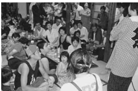
三世代交流納涼大会

です。秋には、武里地区体育祭「防災訓練」、初冬には「芋煮会」「大抽選会」が開催され、会員皆様が楽しんでいきます。お時間がありましたら、ぜひ遊びに来てください。お待ちしております。