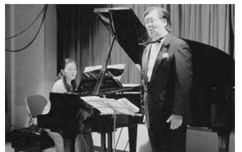
地域活動の充実（音楽会）