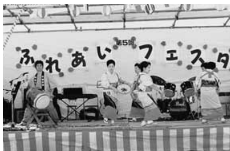
ふれあいフェスタ

町会行事は、メインのふれあいフェスタ（九月）・日帰りバスツアー（十一月）・親子のふれあいもちつき大会（二月）・春秋の町内クリンデー・地区の夏祭り・体育祭と回を重ね、親睦の和を広めています。本年は、町会創立三十周年にあたり、記念に残る行事をと役員をはじめ、会員の皆様からのアイデアをもとに取り組んでいます。