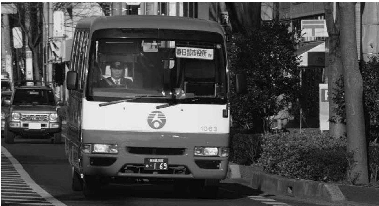
地域をつなぐコミュニティバス「春バス」

自治会・町会・地区・区では、地震・風水害などの災害に備えての自主防災活動や、青少年の健全育成、交通安全、環境美化活動、住民同士の交流を深めるための活動などを行っています。 自治会・町会・地区・区に加入して交流を深め、地域の輪を作りましょう。