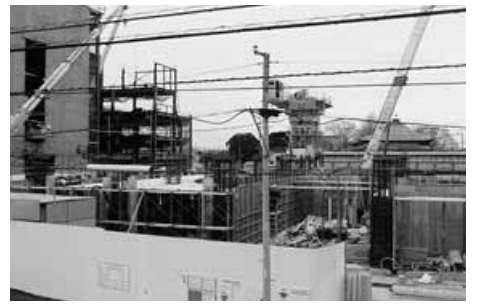
粕壁三丁目A街区再開発事業

前の旧寺町通り、日光街道の旧横町通り、岩槻新道商店街を中心部として現在約百二十世帯で構成されておりです。